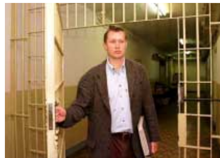
Jenaer Fuchs-Freund Rub Hoffnung auf neue Hinweise

Schriftliches zum Einsatz der Strahlenkanone hat die Stasi in Gera kaum hinterlassen. Zu finden sind ein paar Einmeßprotokolle der Anlage, die beweisen, daß sie zwischen 1976 und 1983 in Betrieb