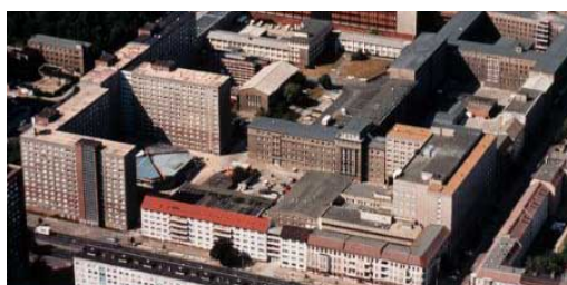
Ex-Stasi-Zentrale in Berlin: „Häufig Fototermine“